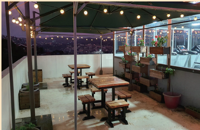
屋上のピクニックエリア