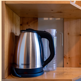
湯沸かし器、ピッチャー