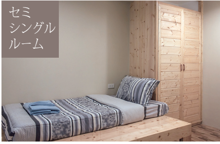
セミ シングル ルーム