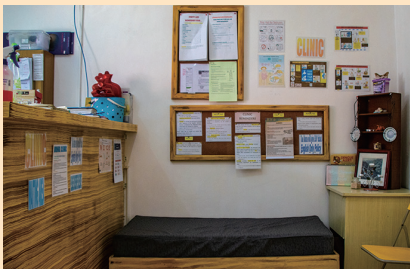
医療支援/クリニック