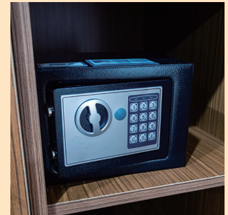
セーフティーボックス